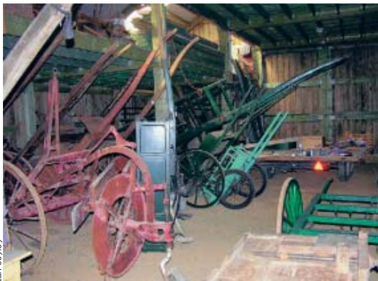
Les richesses du Comité culturel proposent plusieurs charrettes, chariots, calèches et véhicules hippomobiles.